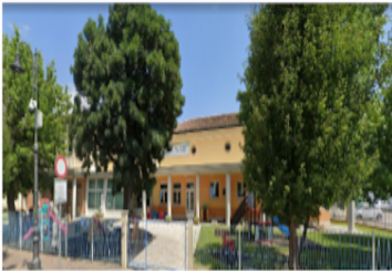
Scuola dell'Infanzia San Giuseppe